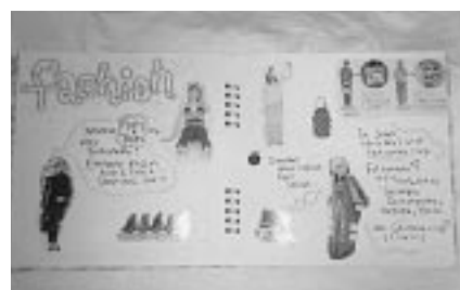
日本人はおしゃれ で有名