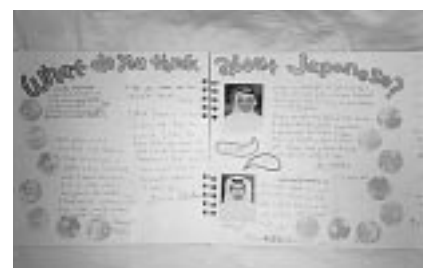
本を見てくれた人に感想を書いてもらいました。