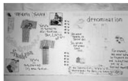
「ゆかた」は世界でも美しい、と人気。

ファッション・ゆかた、食文化・カフェ事情、音楽について、広告・携帯・自動車、習字・花火・舞妓さん、他