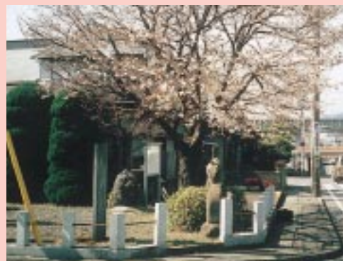
東海道の名所『桜井戸』